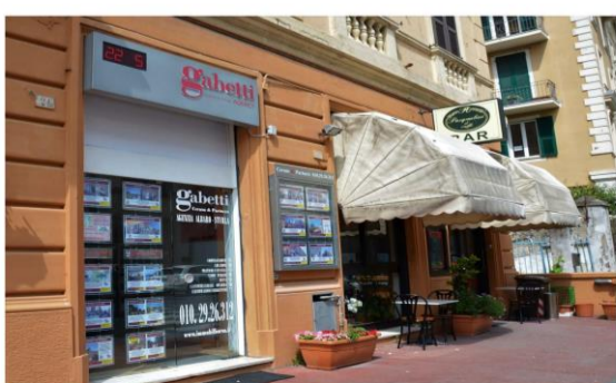
Genova Albaro – Via Amendola 24R